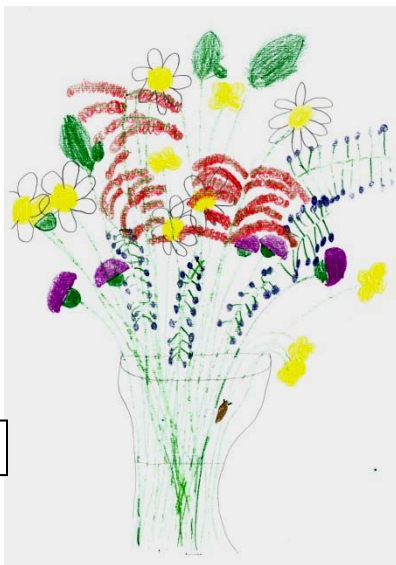
Sara, 1. b

L epa si kot sonček, rada imaš bonbonček, I n crkljava se, zlate lase imaš kot sonček, D obra si in prijazna, boljše mame na svetu ni, I n presrečen sem, da te imam, J az se veselim, ko k tebi prihitim, A mamice moje nobenemu ne dam.