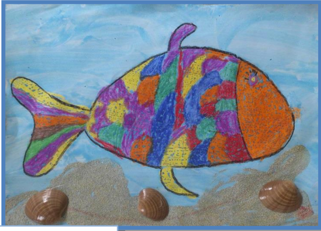
MANCA, 1. C

NEKATERI UČENCI SO SE V ŠOLI V NARAVI, ŽE V ZAČETKU ŠOLSKEGA LETA, PRESKUSILI TUDI V PESNIŠTVU. NASTALE SO NASLEDNJE RIME IN PESMICE: