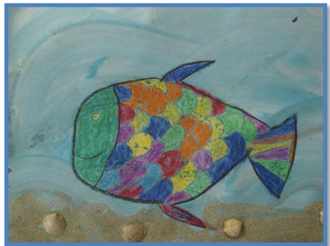
TOMAŽ, 1. C