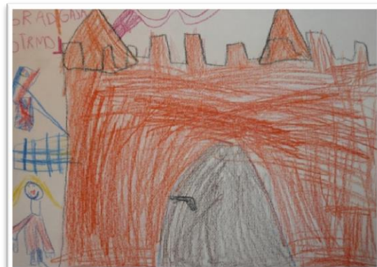
GRAD STRMOL SKUPINA REGA: GAJA