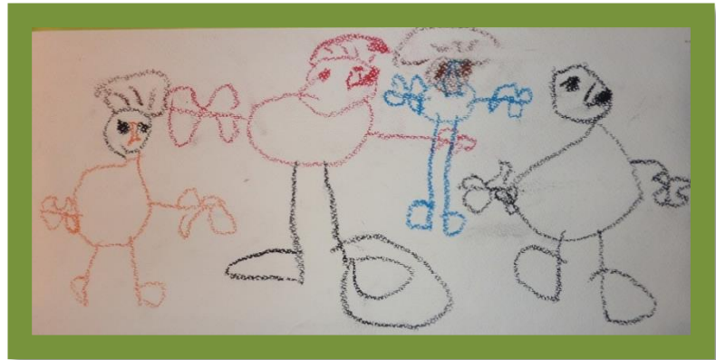
NAŠA DRUŽINA SKUPINA BIBA: AŽBE, 3 LETA