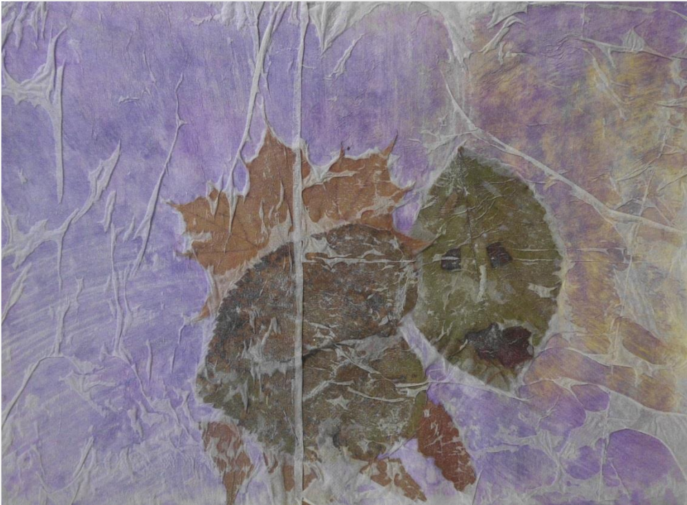
SARA, 1. C