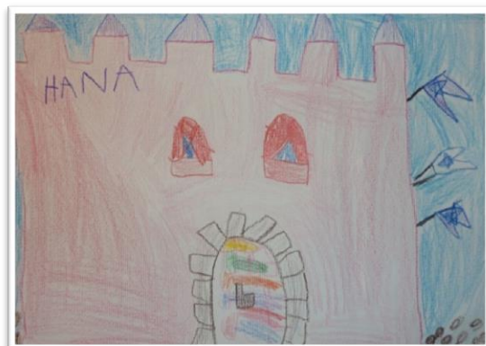
GRAD STRMOL SKUPINA REGA: HANA