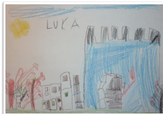
GRAD GRADIČ SKUPINA REGA: LUKA