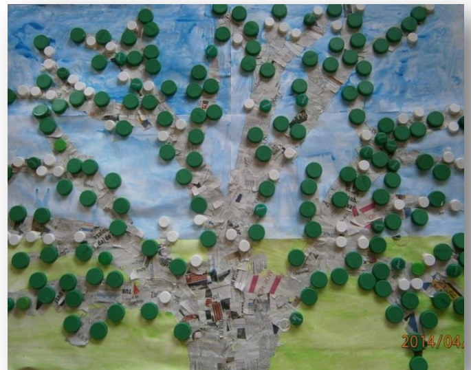
SKUPINA BIBA - POMLADNO DREVO IZ ODPADNEGA MATERIALA