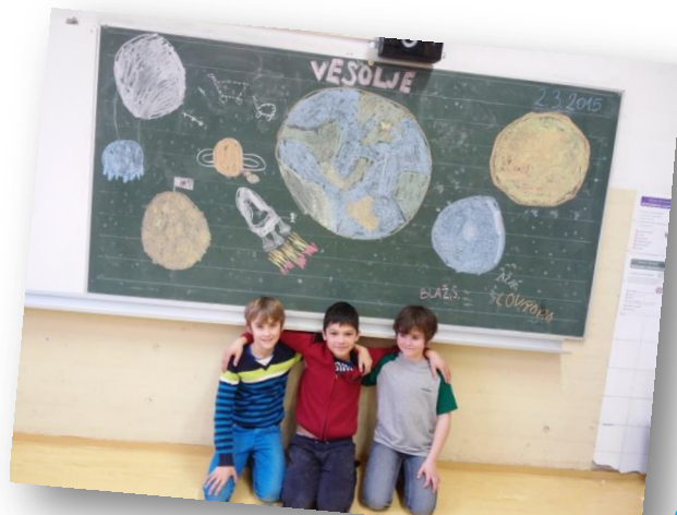
Tretješoleci so narisali vesolje.

Nekega dne, ko smo bili z mlajšim bratcem in starejšo sestro sami doma, je s svetlobno hitrostjo posijal čudežni žarek, ki je našo hišo kar dvignil s tal in poletela je v nebo. Starejša sestra je bila v kopalnici in se ličila. Našla sem njeno igro, ki se je imenovala Sem v vesolju. Takoj sva se z bratcem začela igrati. Potegnila sem karto, na kateri je pisalo: Pazi, da ne zmrzneš. Z bratcem sva se hitro oblekla in se skrila. Sestrica ni vedela in je imela na sebi tanko, svileno obleko. Ko je ledeni sunek prišel do nje, je postala zamrznjena. Ko sva jo šla opozoriti, je bilo že prepozno. Na vrsti je bil bratec. Potegnil je karto in prebral: Veliko vetra. Točno takrat je nad našo hišo nastal velikanski tornado. Hitro sem vzela igro Sem v vesolju,